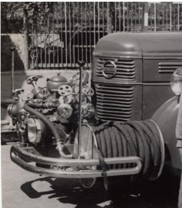
Brandbil (Volvo) från Karlskoga (årsmodell 1947) med Albinpump på 1800 l/min. Det var kårens tyngsta brandbil och den vägde 9 ton – inkl. 2000 liter vatten. Var i tjänst 1963 – utbytt 1964?

Sammanställt av Värmlands Brandhistoriska Klubb, Björn Albinson juni 2023