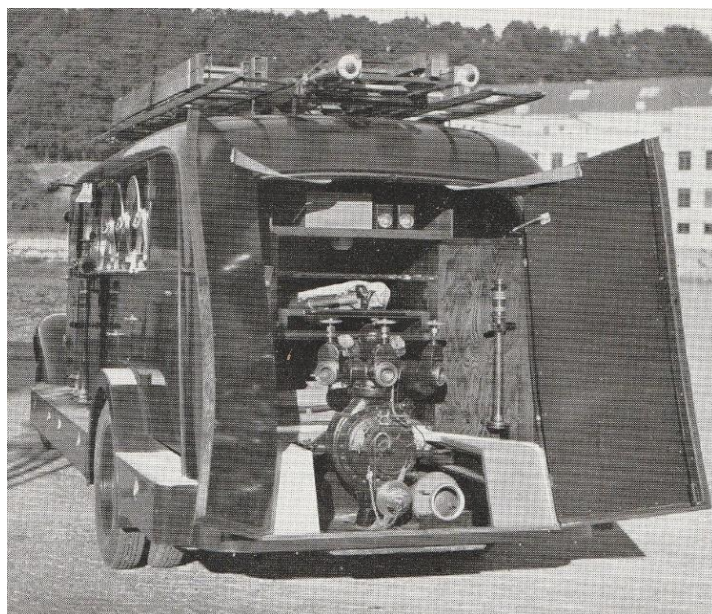
En aktermonterad pump i brandbil från Södertälje.