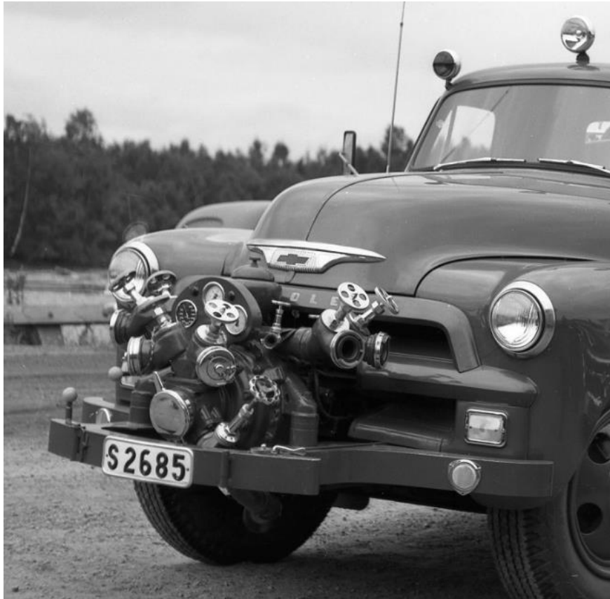
Brandbil (Chevrolet) från Karlstad.