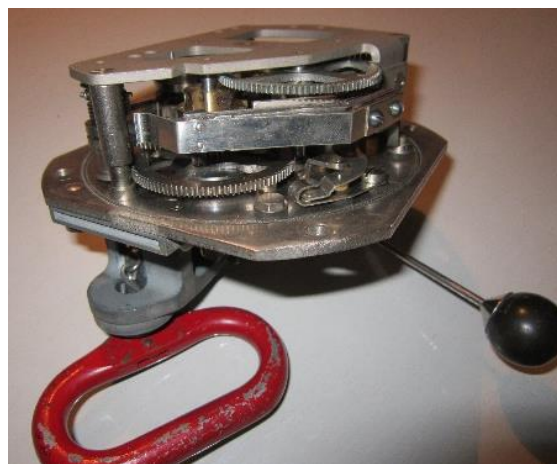
Från ca 1940 med draghandtag