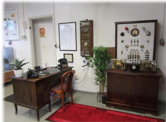
Brandtelegrafer från Arvika och Kristinehamn