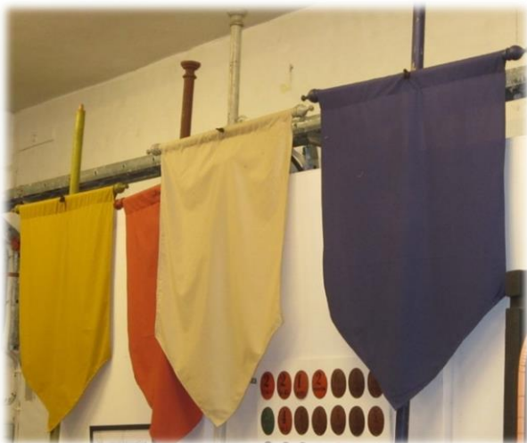
Fanor markerade uppåbådens uppgifter.