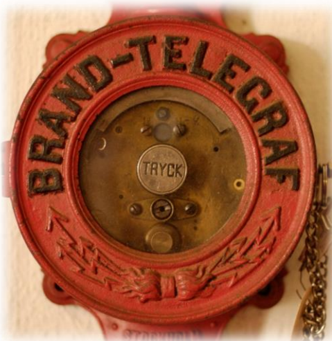
Tryck för att larma brandkåren!