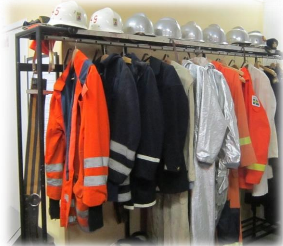
Skyddskläder genom tiderna