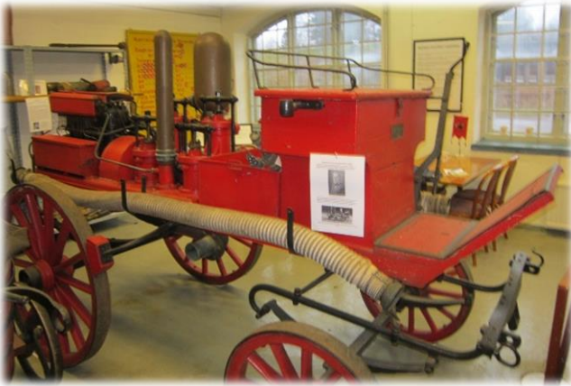
Hästdragen motorspruta från Skoghall