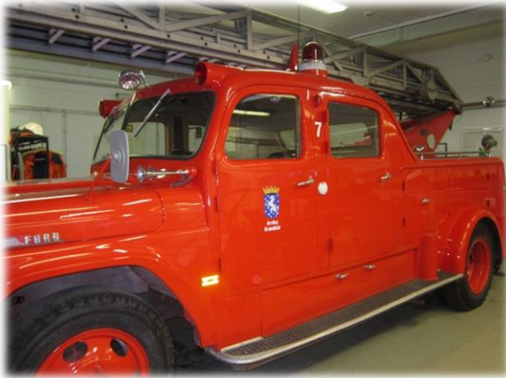
Maskinsteg (Ford 1957 från Arvika)