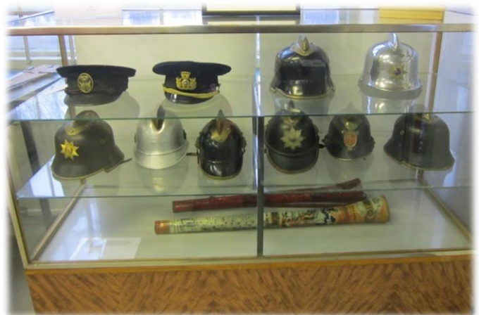
Hjälmar och mössor