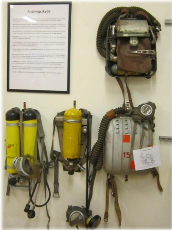
Andningskydd – från syrgas till tryckluft.