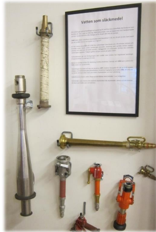
Strålrör för spridda och slutna strålar.