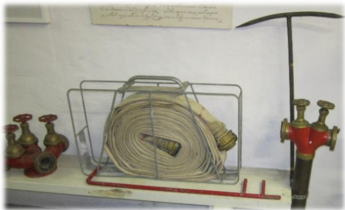
Brandposter, slangar och grenrör