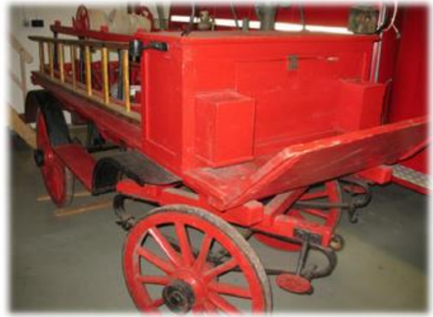
Redskapsvagn från Skoghall