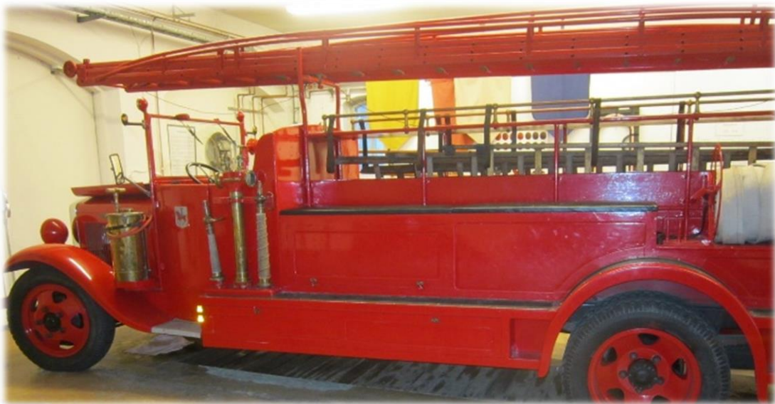
Brandbil från Filipstad - årsmodell 1934