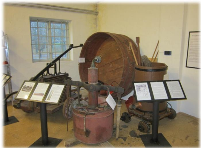
Hinkar, pumpar och kar för trygg vattenförsörjning.