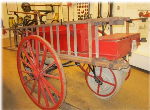
Redskapskärra av typ som funnits i Säffle