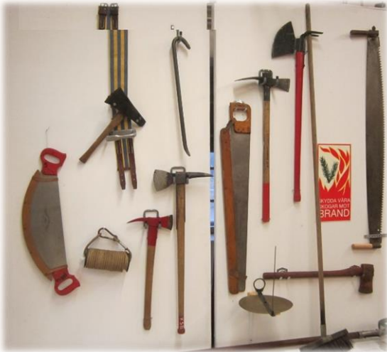
Redskap för brandsläckning