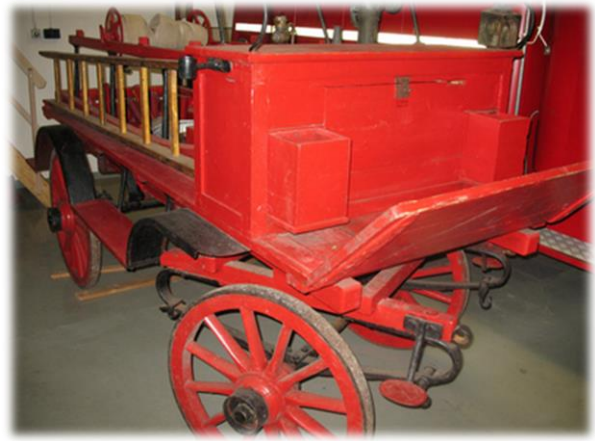
Redskapsvagn från Skoghall