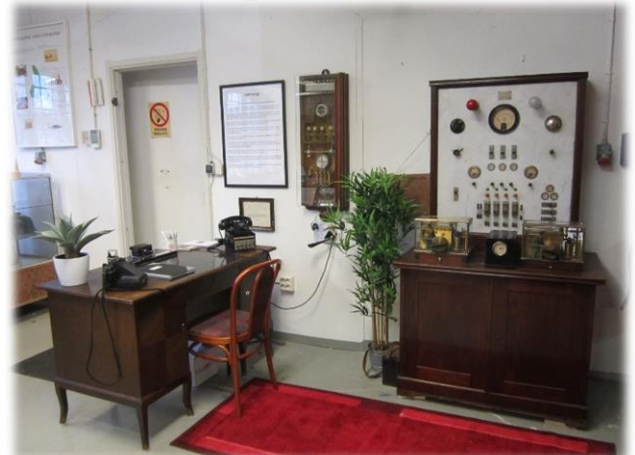
Brandtelegrafer från Arvika och Kristinehamn