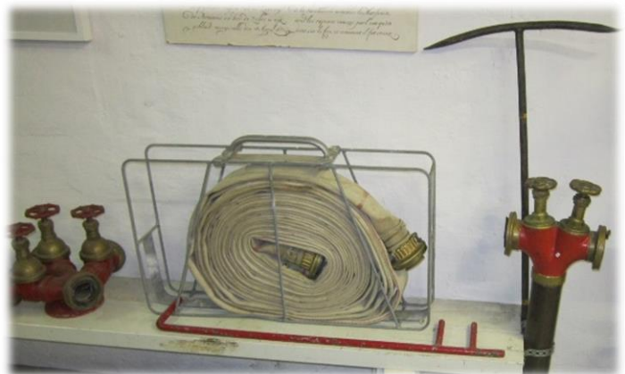
Brandposter, slangar och grenrör