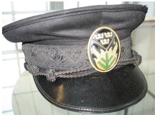
Skogsbrandfogdens mössa med symbol

En skogsbrandfogde var chef i roten. Han skulle planera släckning, utöva viss tillsyn och leda släckningen. Skogsbrandfogden skulle larma de släckningsskyldiga och utöva befäl samt fick hålla kvar manskap för eftersläckning. Redskapen var hackor, spadar, yxor, sågar och hinkar vilka inköptes. Han skulle förteckna fordon, delta vid lokala skogsdagar och informera om skogsbrandfaran. Bolagens skogsvaktare hade skyldigheter att förebygga skogsbränder och bevaka de egna skogarna.