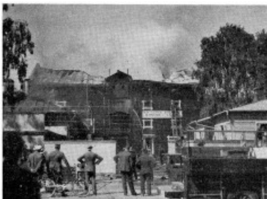
Branden i tidigt skede

Kaffemassorna gav intensiv hetta och tjock rök vilket försvårade släckningen.